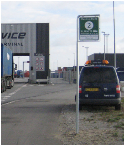
Meeting Point 2 – ved porten til Containerterminalen

Der er etableret 6 Meeting Points, for at få hjælp frem hurtigst muligt. Se kortet på bagsiden.