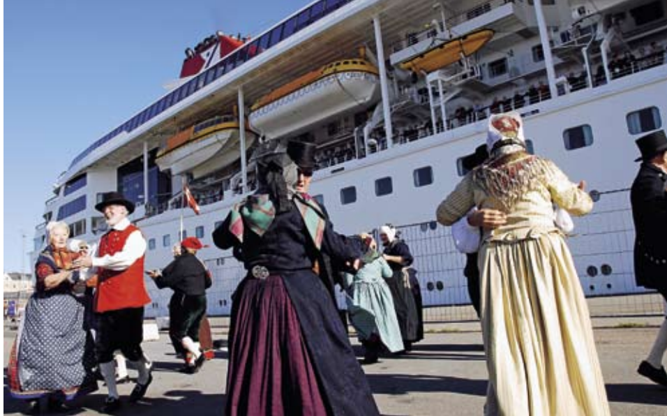
Visit Aarhus sørger altid for at give passagerer og besætning om bord på krydstogtskibene en festlig modtagelse. Sådan var det også, da "M/S Braemar" lagde til kaj 18. september.