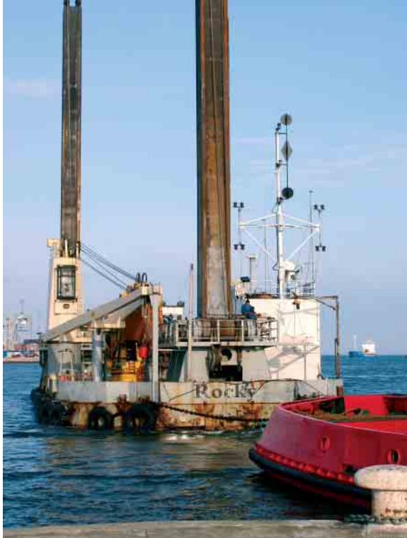
Gravemaskinen Rocky fra det svenske firma Boskalis ankom til Århus havn den 21. februar. Den blev trukket af slæbebåden "West Sund" fra Svendborg Bugser. To dage efter ankomsten begyndte gravearbejdet i Østhavnen.

Gravearbejdet udføres af firmaet Boskalis Sweden, der vandt arbejdet ved en licitation i slutningen af januar. Firmaet vil udføre dette arbejde med en meget stor gravemaskine på en jack-up flåde og selvejende pramme, som skal transportere det opgravede materiale. Gravemaskinen, som hedder Rocky, kan udgrave til 25 meter under havets overflade, så der er rigelig kapacitet til at udgrave til de 14 meter, som skal være dybden langs den nye containerkaj. Gravemaskinen, Rocky, benytter en skovl, der kan rumme 16 kubikmeter ad gangen, og det forventes derfor, at gravearbejdet i Århus havn allerede vil være færdigt i begyndelsen af april i år.